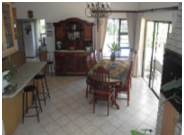
Esszimmer mit Bar

Alle Angaben nach bestem Wissen. Irrtum und Zwischenverkauf vorbehalten. Dieses Exposé ist eine Vorinformation, als Rechtsgrundlage gilt allein der notariell abgeschlossene Kaufvertrag.