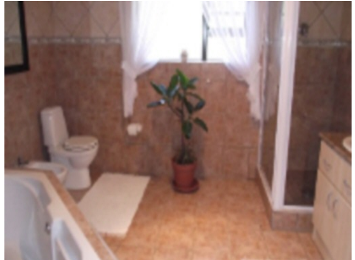
Badezimmer in mediterranem Stil