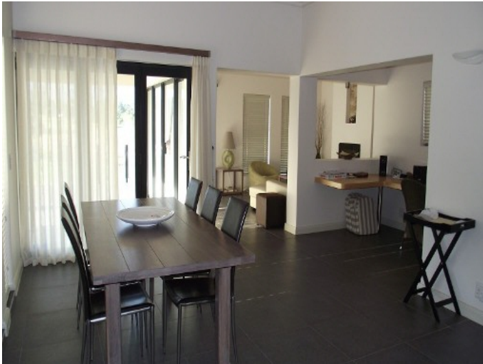
Offener Wohn- und Essbereich mit Arbeitsecke