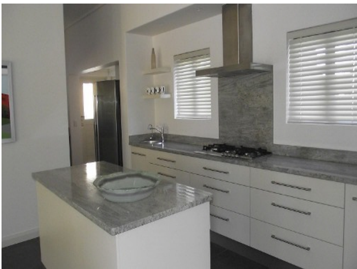
Moderne Küche mit großen Arbeitsflächen