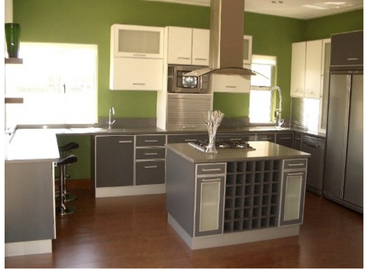
Moderne Küche mit bester Innenausstattung