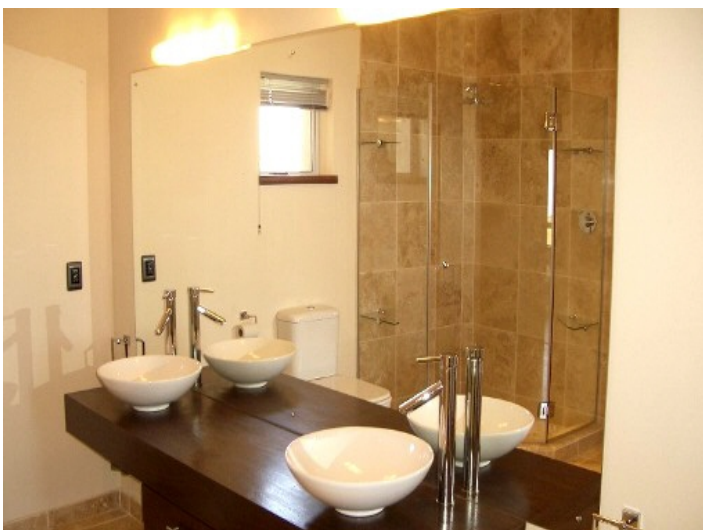
Modernes Badezimmer mit zwei Waschbecken