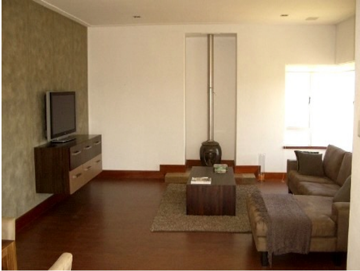
Teil des Wohnzimmers