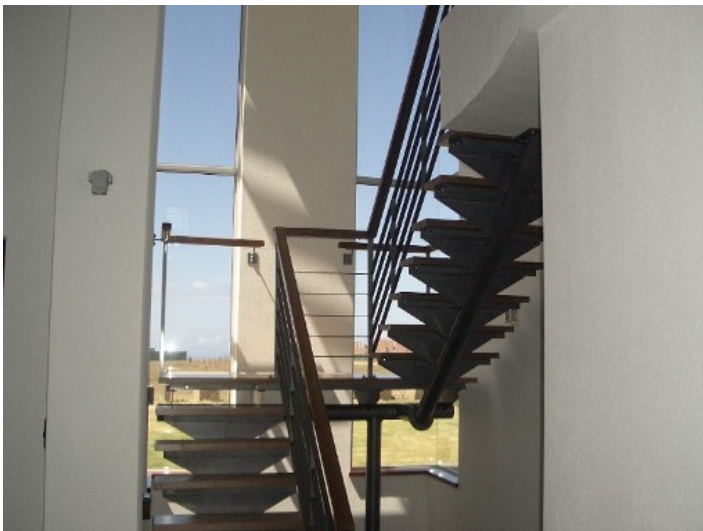
Treppenaufgang mit hohen Fenstern