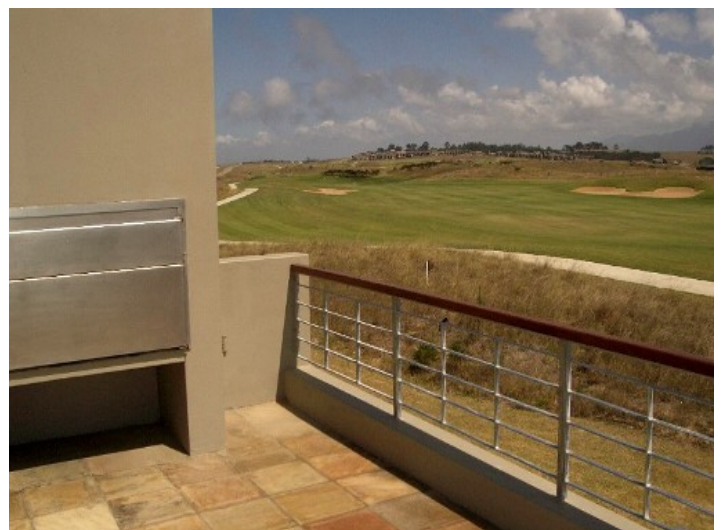
Ausblick von einem der Balkone zum Golfplatz

Alle Angaben nach bestem Wissen. Irrtum und Zwischenverkauf vorbehalten. Dieses Exposé ist eine Vorinformation, als Rechtsgrundlage gilt allein der notariell abgeschlossene Kaufvertrag.