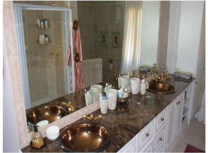
Badezimmer mit zwei Waschbecken